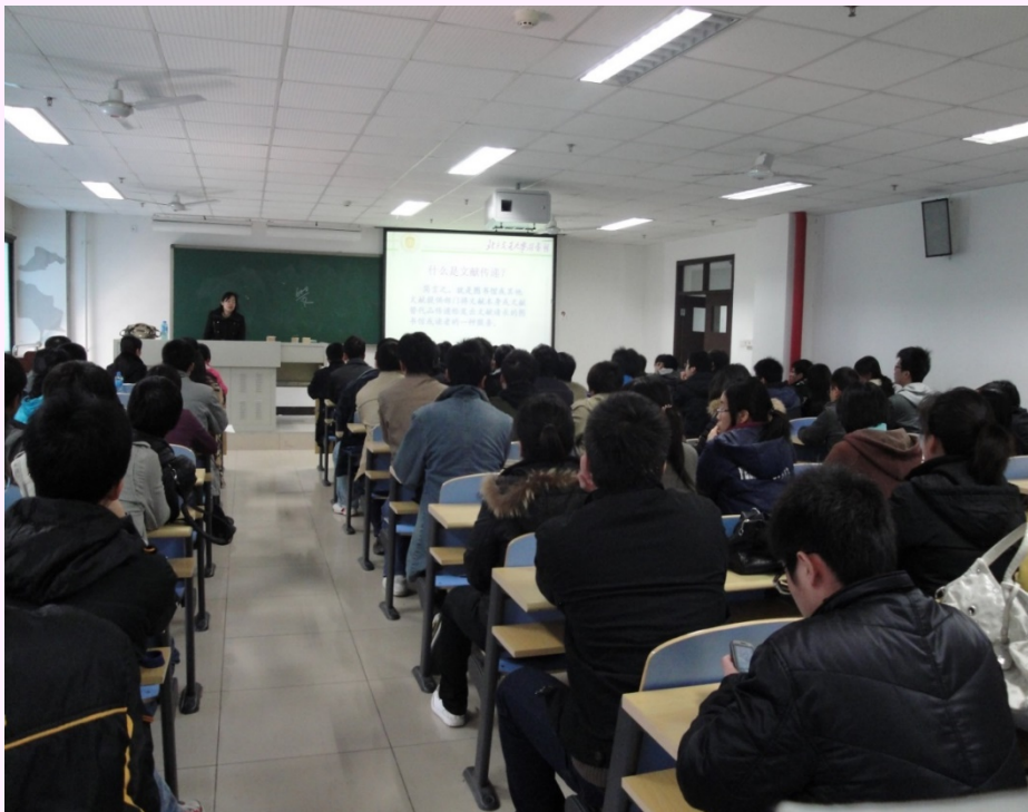
经管学院107名博硕士生及教师 现场学习

博硕士生是潜心学习的庞大群体、是外文文献的超级用户，是我们心目中的“学神”，也是文献传递的重点服务对象。到他们中间去，清楚、明白地告诉他们：“找论文，用balis”