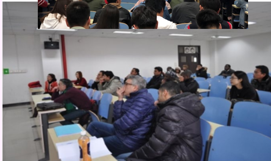
不能忽视的留学生群体